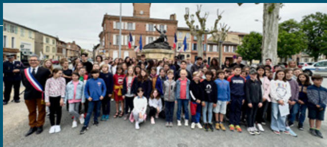
Cérémonie du 9 mai en commémoration de la déclaration de Robert Schuman marquant le début de la construction communautaire, en présence des élèves du group scolaire Puysegur.