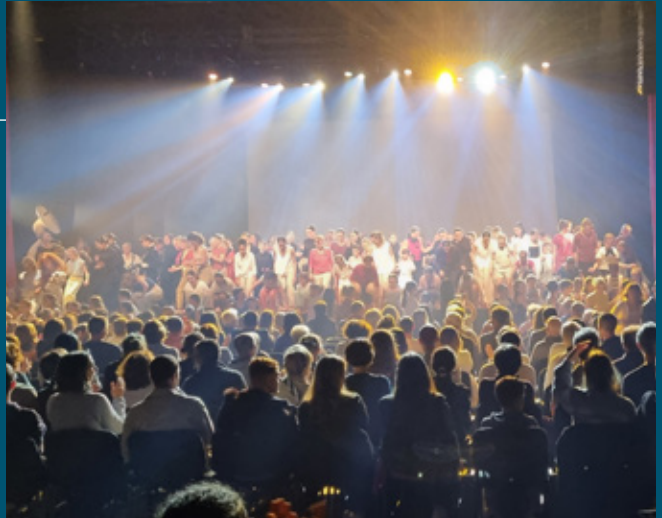
Spectacle de fin d'année de l'Atelier de Danse de Rabastens le 19 mai au Bascala de Brugières (830 spectateurs pour applaudir 190 danseurs de 4 à 64 ans).