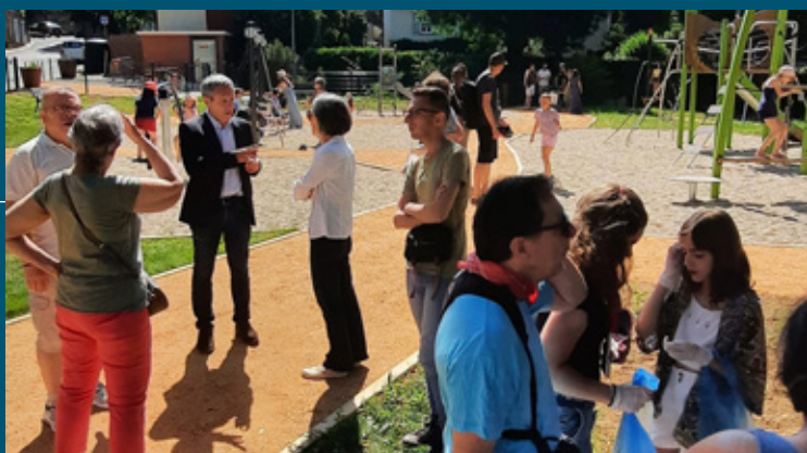
Ouverture de l'aire de jeux de Constance le 11 juin.