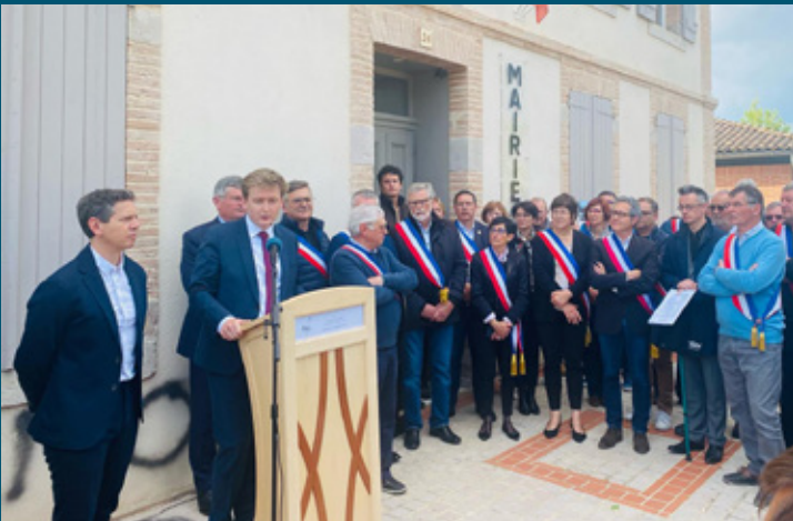
Manifestation de soutien des élus au maire de Montans, victime d'actes d'intimidation le 15 mai.