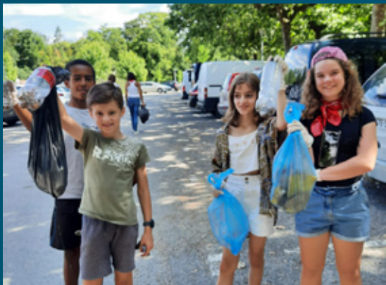
Opération de nettoyage des Promenades à l'initiative du Conseil municipal jeunes le 11 juin.