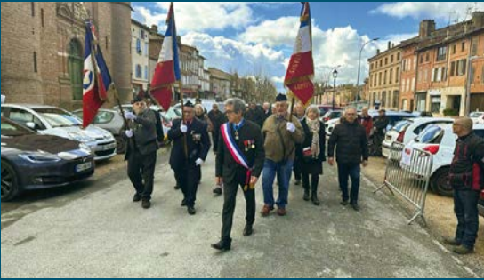
Cérémonie pour la Journée nationale du souvenir et de recueillement à la mémoire des victimes civiles et militaires de la guerre d'Algérie et des combats en Tunisie et au Maroc, le 19 mars 2023.