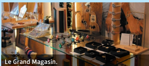
Le Grand Magasin.