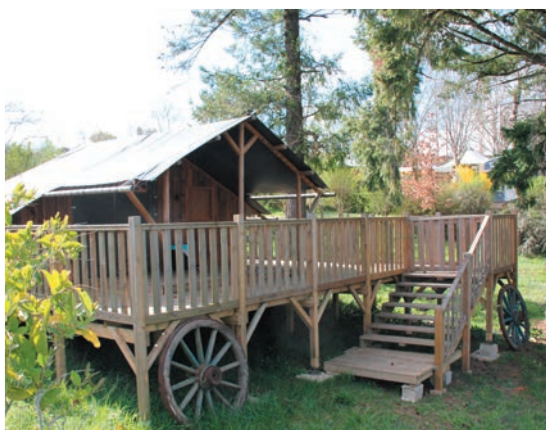
La cabane du trapeur

Nous avons vu sur internet l'annonce de sa vente. Cela faisait quelques années que nous réfléchissions à acheter notre camping, mais les offres dans les Landes étaient hors de prix. Nous recherchions un camping à taille humaine et familial. Nous avons donc saisi l'occasion. Nous avons engagé les démarches auprès de la mairie et nous avons été retenus. Nous avons présenté un projet qui inclut toujours du camping traditionnel, mais propose également de l'hébergement insolite et en chalet afin d'élargir le public.