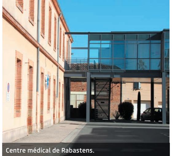
Centre médical de Rabastens.

Le bassin rabastinois doit rester attractif et proposer une offre de santé suffisamment étoffée. L'enjeu est donc de fournir à chaque Rabastinois un médecin référent. Les préoccupations se portent aussi sur l'avenir de l'Ehpad qui doit être conforté, car elle est en difficulté depuis 10