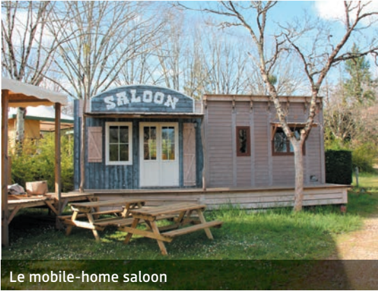
Le mobile-home saloon

Le Camping du Lac, comme nous l'avons baptisé, compte quarante-quatre emplacements sur lesquels se trouvent notamment dix chalets d'une capacité de cinq places, une cabane du trappeur de quatre places, un mobile-home, mais aussi des hébergements plus originaux comme une diligence. Il restera évidemment des emplacements pour camping-cars, caravanes et tentes. Nous prévoyons d'installer deux nouveaux mobile-homes l'année prochaine, voire d'autres hébergements insolites. L'idée est vraiment de pouvoir ouvrir le camping plus longtemps.