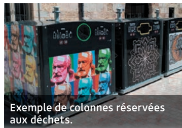
Exemple de colonnes réservées aux déchets.

La collecte des déchets en centre-ville à Rabastens va donner lieu à la mise en place de points d'apport volontaire. Comme indiqué dans le dernier numéro du journal municipal, ce changement dans la collecte s'explique pour des questions d'accessibilité des camions-bennes, d'insalubrité (sacs devant les portes) mais aussi de conditions de travail des ripeurs obligés de porter les sacs (les bacs roulent et sont directement versés dans le camion). À titre expérimental, cinq sites pour installer des colonnes aériennes ont été définis pour collecter les déchets ménagers et les emballages en complément du bac à verre. Les colonnes devraient