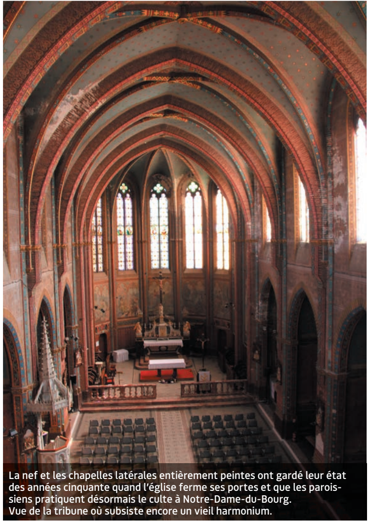
La nef et les chapelles latérales entièrement peintes ont gardé leur état des années cinquante quand l'église ferme ses portes et que les paroissiens pratiquent désormais le culte à Notre-Dame-du-Bourg. Vue de la tribune où subsiste encore un vieil harmonium.

L'église Saint-Pierre-des-Pénitents-Blancs a été construite entre 1894 et 1896. Son origine est en réalité plus ancienne puisqu'une chapelle, occupée par la congrégation des Pénitents blancs, se trouvait à son emplacement à partir du XVII e siècle. Fermée et vendue comme bien national en 1796, elle "échappe" aux destructions de la Révolution et rouvre ses portes, mais elle devient trop petite pour accueillir les nombreux Rabastinois. Un projet de nouvelle église néogothique en briques est envisagée à son emplacement. Elle est inaugurée en 1832 et consacrée à saint Pierre (d'où son nom). La paroisse est supprimée en 1952, mais l'église, propriété de la collectivité, reste consacrée au culte. L'église ferme pendant plus de cinquante ans, jusqu'à ce que l'association des amis de Saint-Pierre-des-Blancs lui redonne vie en organisant des expositions d'art contemporain.