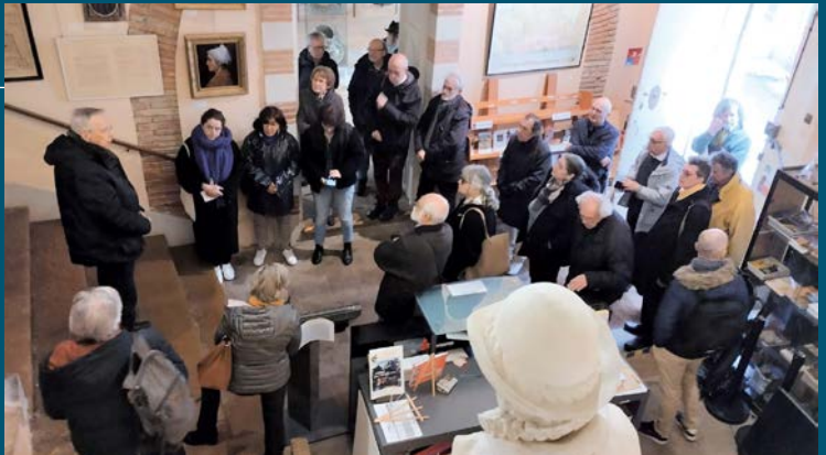
Congrès de la Fédération des Associations culturelles et intellectuelles du Tarn (FACIT) en Pays rabastinois, visite du musée, le 11 mars 2023.