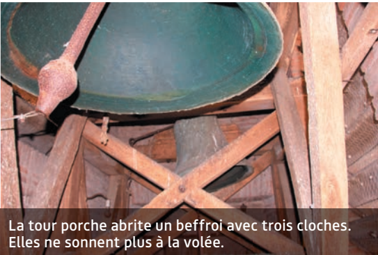
La tour porche abrite un beffroi avec trois cloches. Elles ne sonnent plus à la volée.