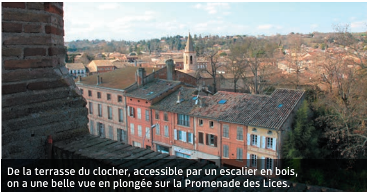
De la terrasse du clocher, accessible par un escalier en bois, on a une belle vue en plongée sur la Promenade des Lices.