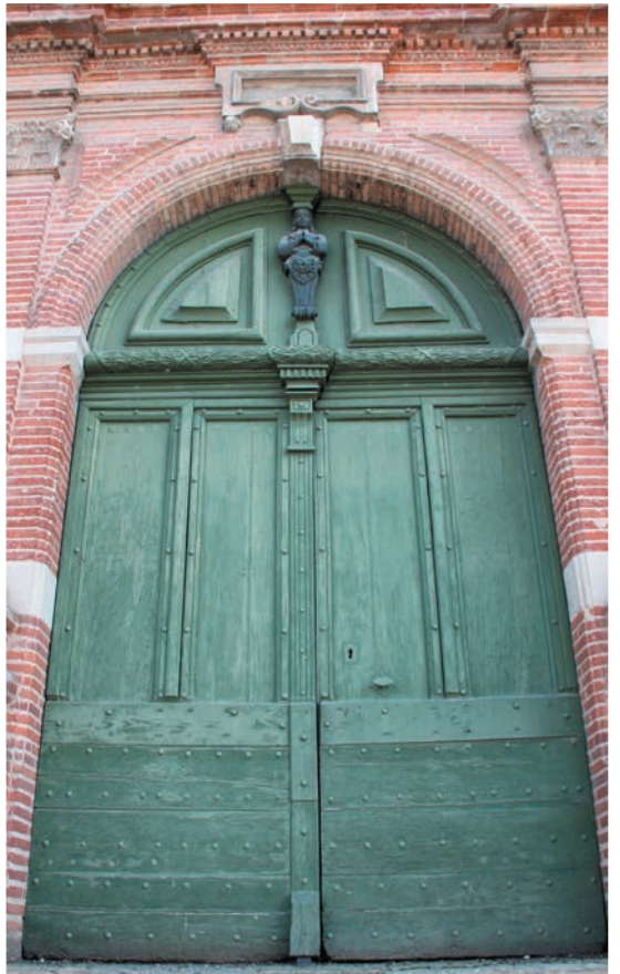
L'imposante porte de l'église condamnée depuis de nombreuses années, faute d'escalier !