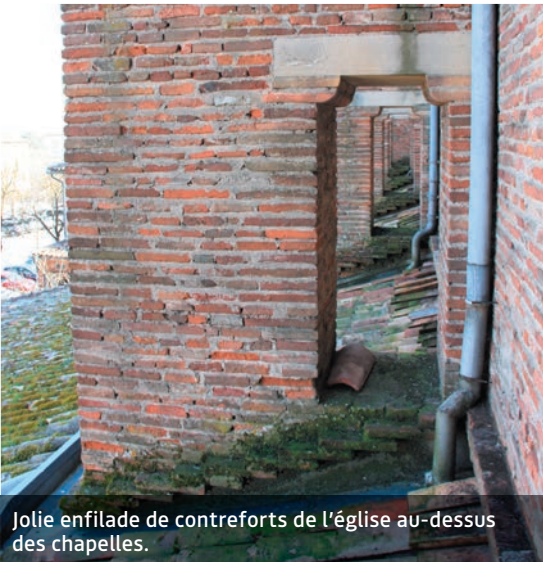
Jolie enfilade de contreforts de l'église au-dessus des chapelles.