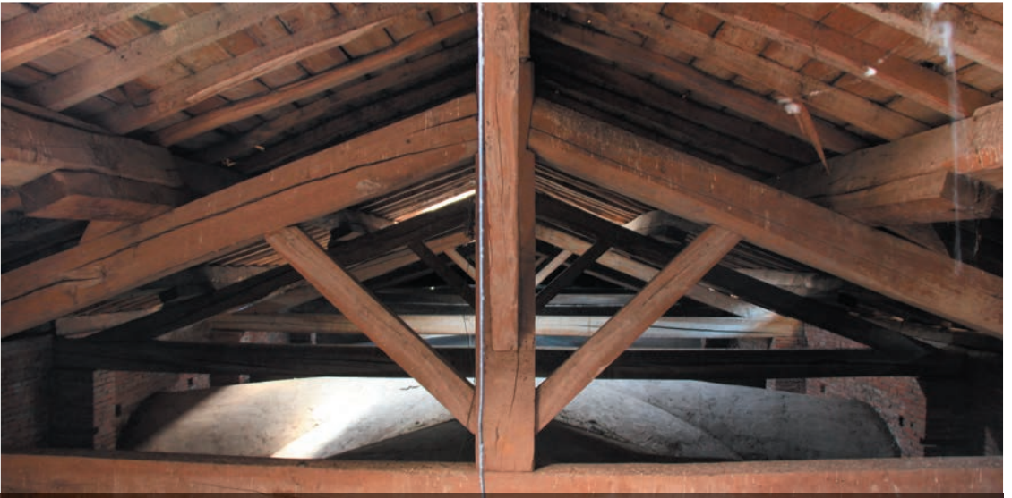
Au-dessus de la nef, une belle charpente en bois supporte la toiture. Un diagnostic est en cours pour évaluer son état.