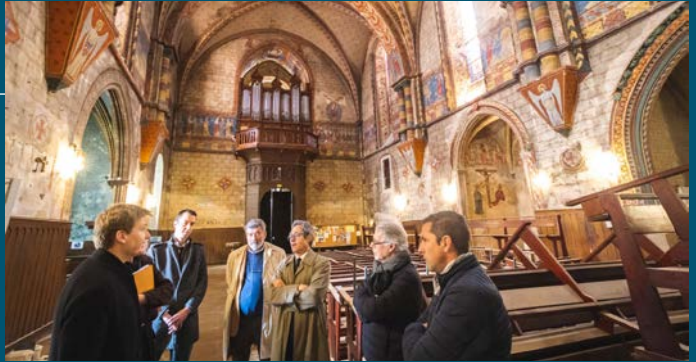
Visite des travaux de Notre-Dame-de-Bourg par le préfet du Tarn, le 14 mars 2023.