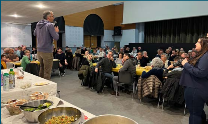
Soirée Festiv'Halle, ciné courts-métrages salades, le samedi 18 mars.