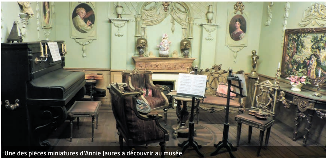
Une des pièces miniatures d'Annie Jaurès à découvrir au musée.